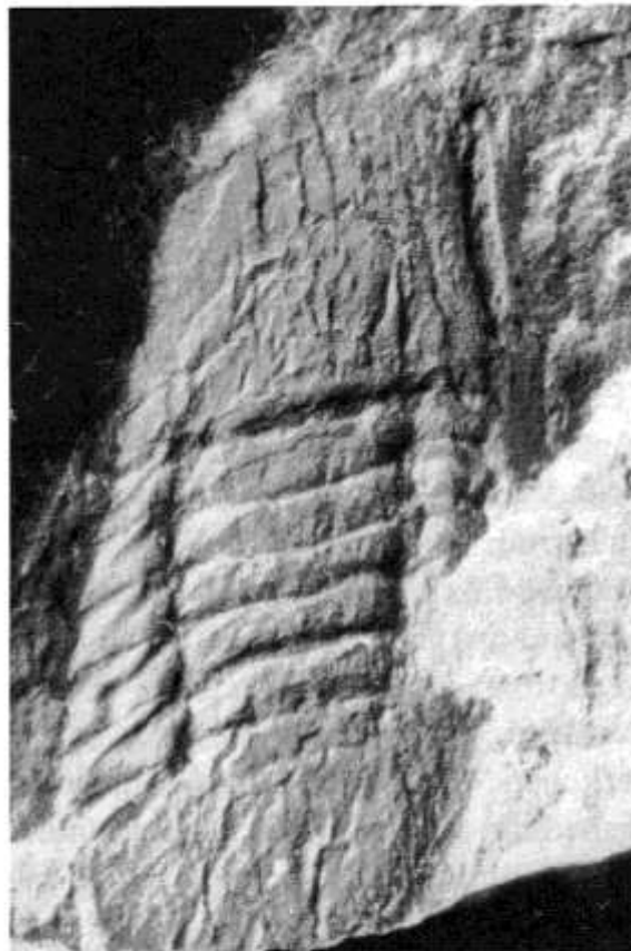
Abb.3: Microparia (Microparia) aff. zdenkoniki HÖRBINGER 1988 [= Cyclopyge (Microparia) speciosa CORDA 1847? sensu Rud. & E. RICHTER 1954]; Unterer Tonschiefer (Llanvirn) von Wupperhof (Remscheider Sattel). - Fast vollständig erhaltener Panzer, Negativ-Platte, durch fotografische Umkehrung positiv dargestellt (x 4,2).

L o c . t y p . / S t r a t . t y p . : Praha-Vocovice / Šárka-Formation (Llanvirn).