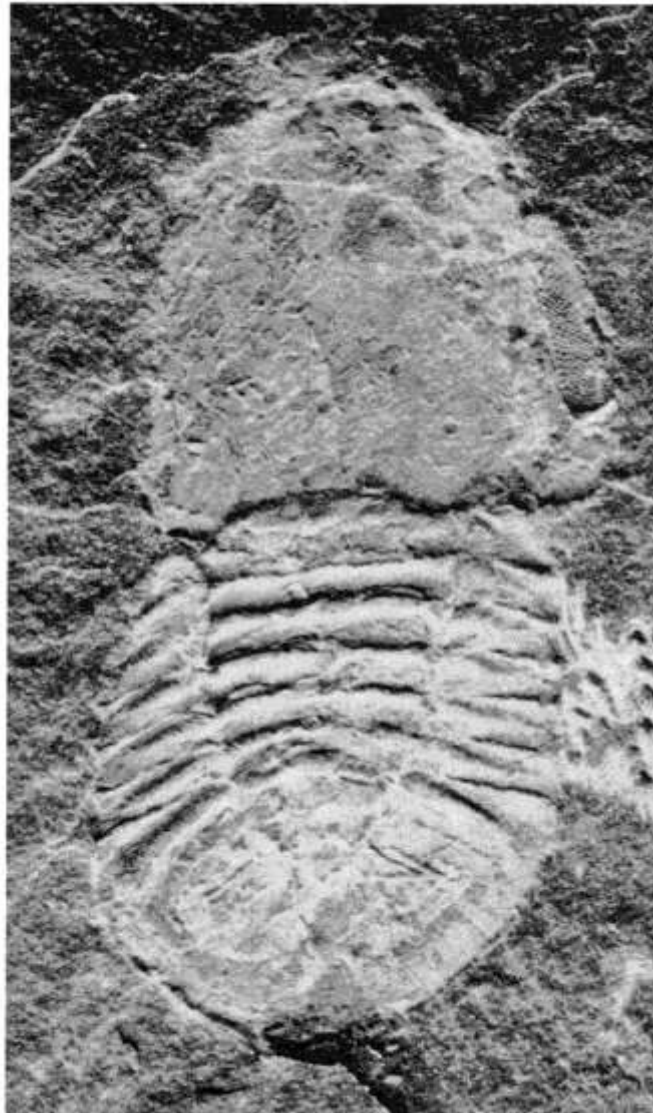
Abb.2: Degamella praecedens (KLOUČEK 1916). Unterer Tonschiefer (Llanvirn) von Wupperhof (Remscheider Sattel). - Kompletter Panzer, Negativ-Platte, durch fotografische Umkehrung positiv dargestellt (x 4,3). leg. KOENEN, 1988. - Aufbewahrung: Geologisches Institut der Universität zu Köln, GIK 1530b.

H o l o t y p : Teil eines Cephalons, abgebildet bei MAREK (1961): Taf.4 Fig.8-9, durch Monotypie; Original bei KLOUČEK (1916); SBNM CD 369.